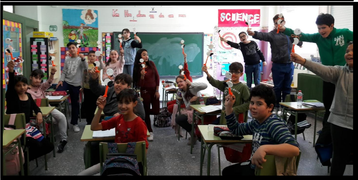
Alumnos realizando el taller de las cigüeñas.