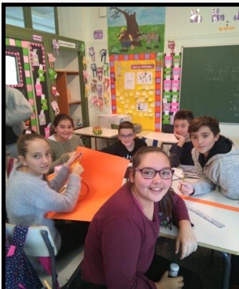
Alumnos trabajando en los carteles para el mural.